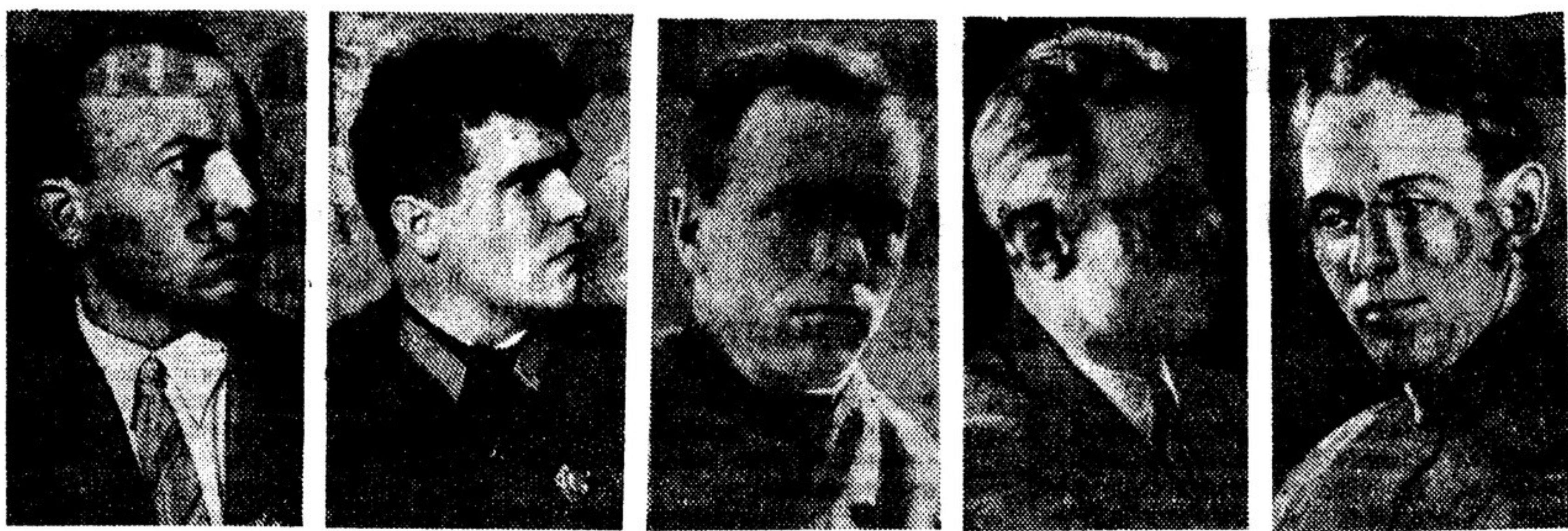
Писатели-делегаты XVIII съезда ВКП(б). Слева направо: Г. Байдуков, М. Водопьянов, А. Прокофьев, А. Фадеев и М. Шолохов.

И за эту страну под грохот орудий Станем все, отовсюду грозя, Потому что, когда стали стальных люди, То отнять это счастье нельзя!